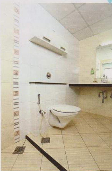
വിശാലമായ ബാത്ത് റൂം സ്പെയ്സ്

അതീവ ശ്രദ്ധയോടെയാണ് ഇവിടെ സംയോജിപ്പിച്ചിരിക്കുന്നത്. ഇതിനു പുറമേ മുറിയുടെ ഭംഗി കൂട്ടുന്നതിനായി ഗ്രേ നിറം കലർന്ന ജ്യൂട്ട് മെറ്റീരിയലും ഉപയോഗിച്ചിരിക്കുന്നു. ഒരു 3 സീറ്ററും സിംഗിൾ സീറ്ററും 2 സീറ്ററും അടങ്ങുന്നൊരു സെറ്റാണ് ഇവിടുത്തെ സോഫ യൂണിറ്റ്. സോഫയുടെ ബാക്ക്റെസ്റ്റായി സ്റ്റെയ്ൻലെസ്സ് സ്റ്റീലാണ് തിരഞ്ഞെടുത്തിരിക്കുന്നത്.