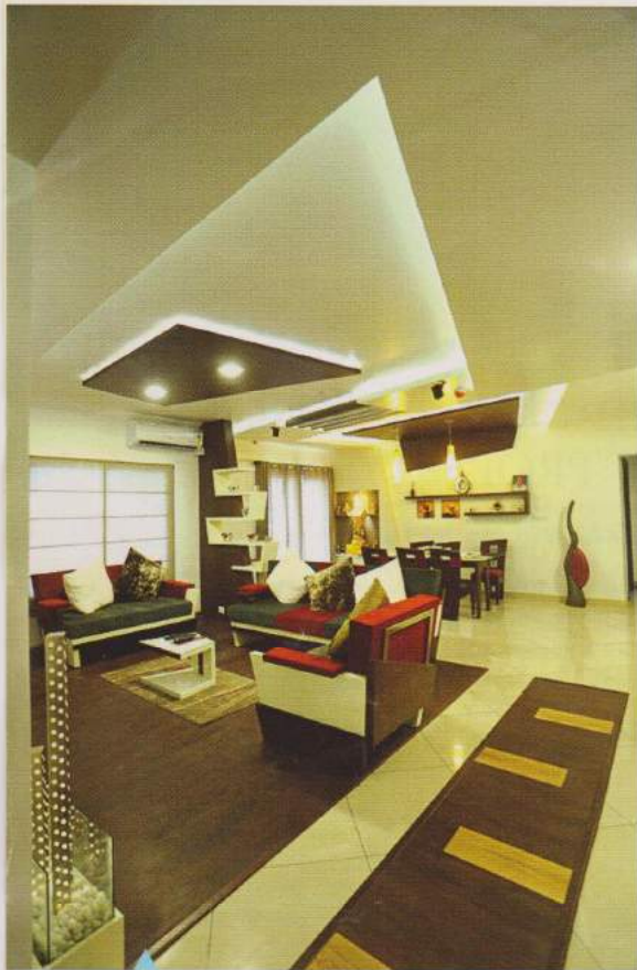
ലിവിംഗ് ഏരിയ മറ്റൊരു ദൃശ്യം