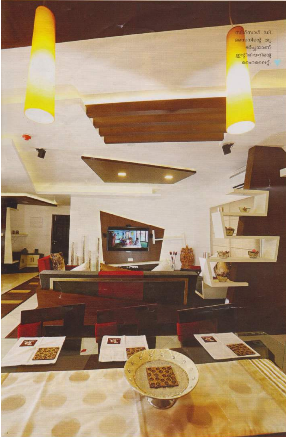
സിൾസാൾ ഡിസൈനിന്റെ തൃക്കൂപ്പായാണ് ഇന്റീരിയറിന്റെ ഹൈലൈറ്റ്.